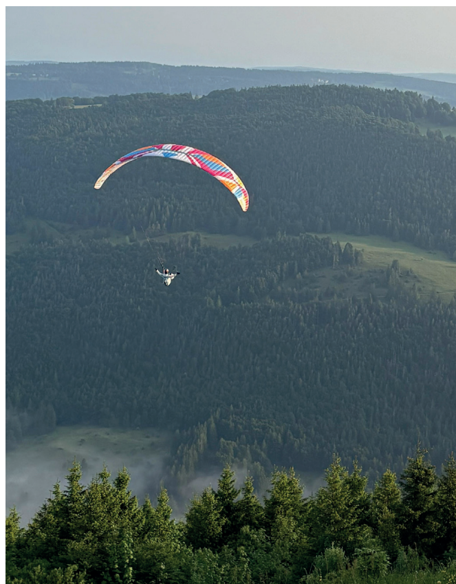
La pilote s'envole au Buement.