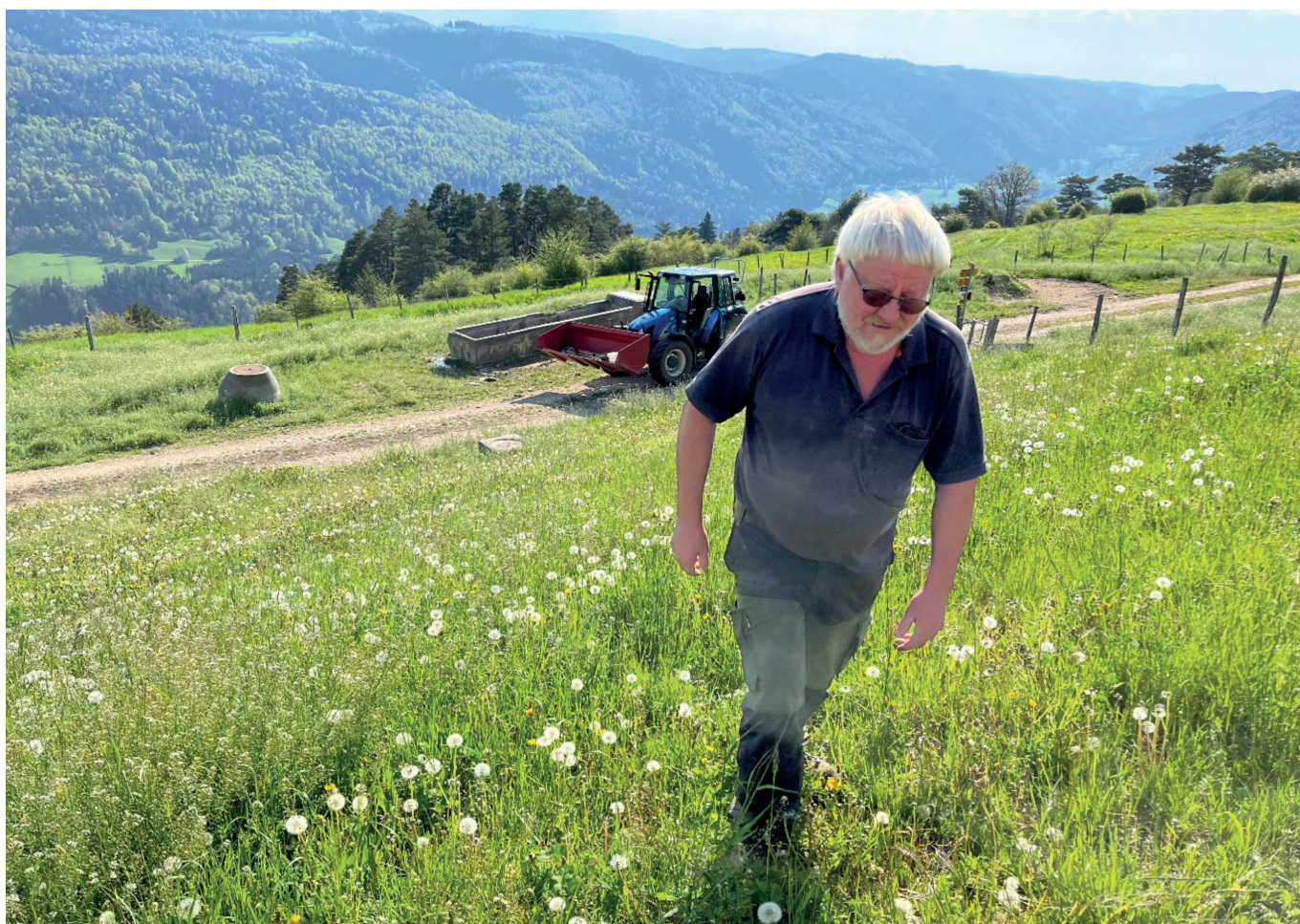
À la recherche du bétail perdu... (DB)

Foutre une cuite à quelqu'un (gros rires) ! Mais le fait d'être employé en gérant mon travail comme indépendant a ses avantages. Bien sûr, on ne compte pas ses heures, mais je m'organise comme je veux et la vie au grand air me plaît beaucoup.