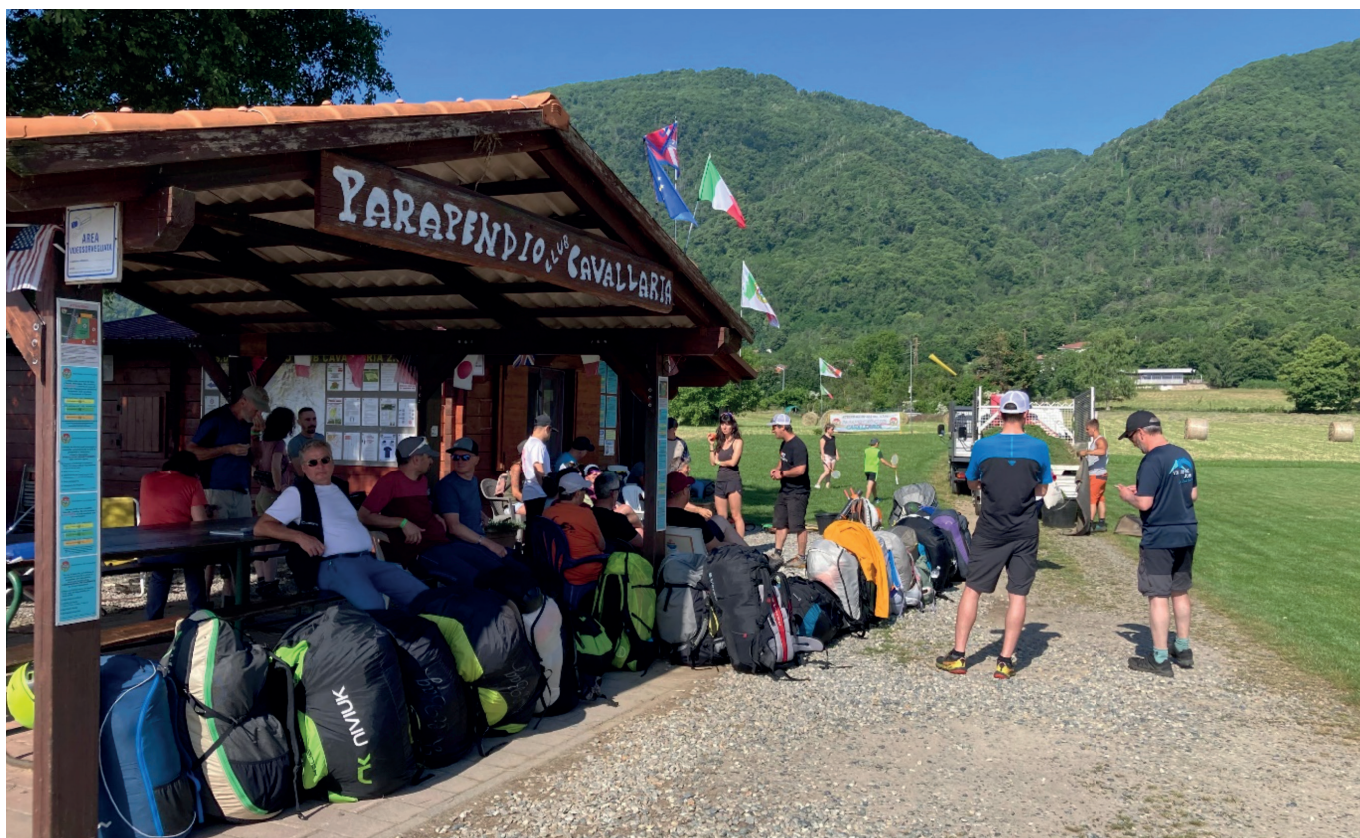
Une belle file d'attente de sacs jurassiens. (VG)