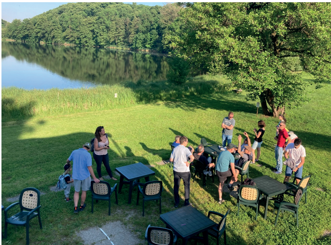
Apéro au bord du Lac d'Alice.