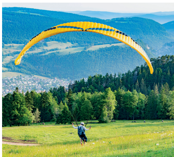
Loïc Theubet au déco de Graiteray.