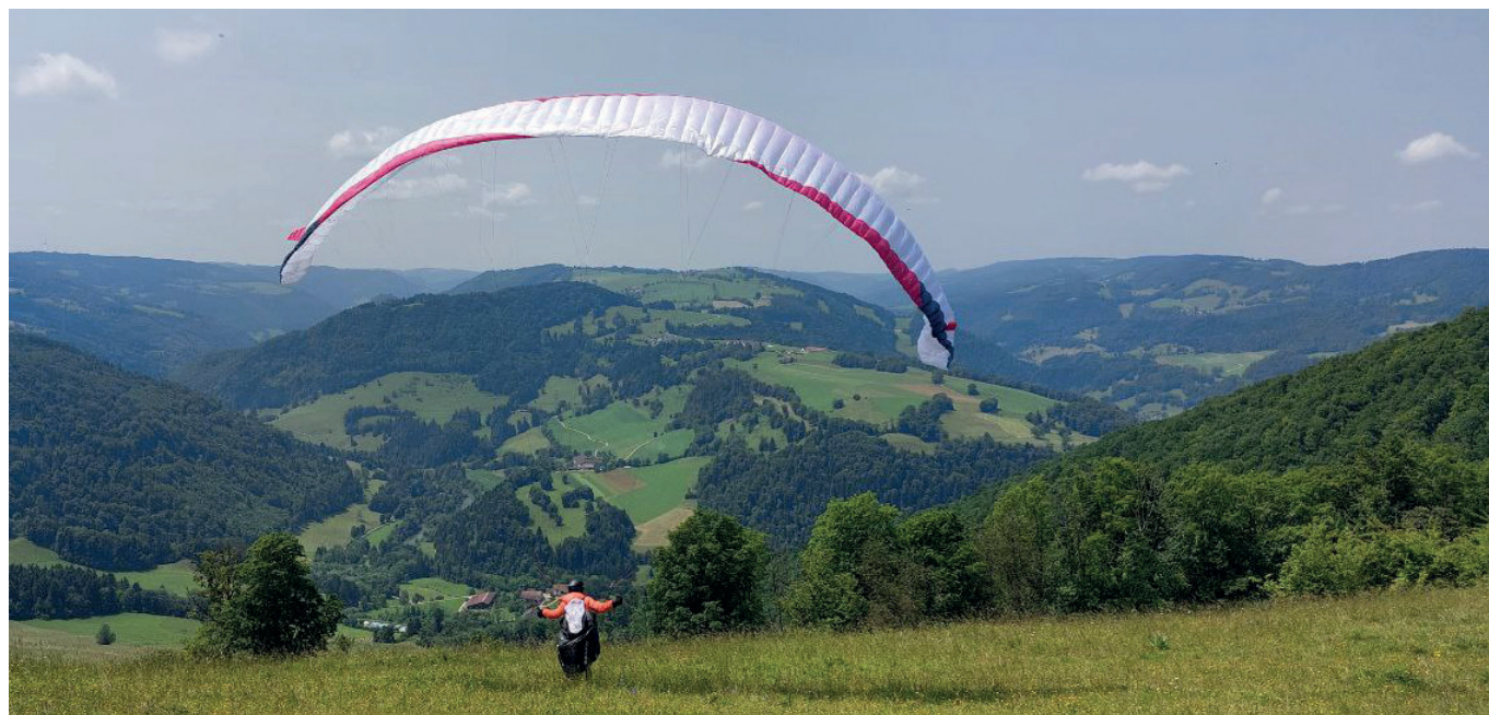
Idris Birch, vainqueur de la course. Déco de Montmelon.