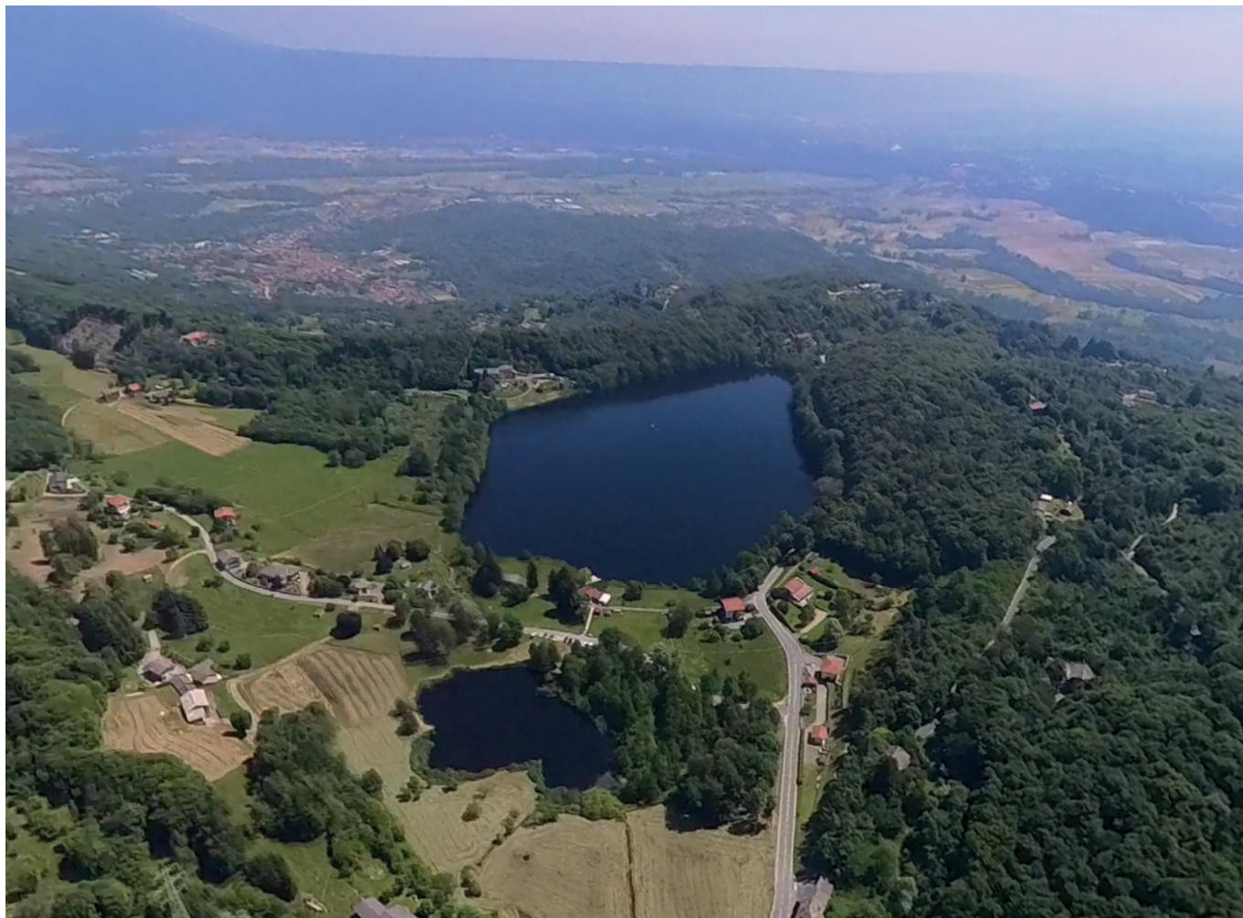
Lago d'Alice. (VG)

Plusieurs semblent motivés pour refaire à l'avenir ce genre de petites compétitions. Avec quelques explications supplémentaires sur l'utilisation des applications de vol, ça promet de belles rigolades. »