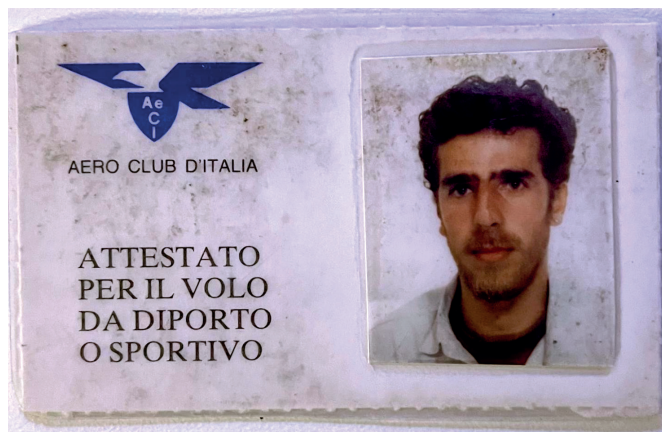
Brevet du 19.05.1990.

Le conseil principal, c'est déjà d'aller avec les personnes qui vont faire du cross. Histoire de ne pas rester sur le même site pendant deux heures. Essayer de se