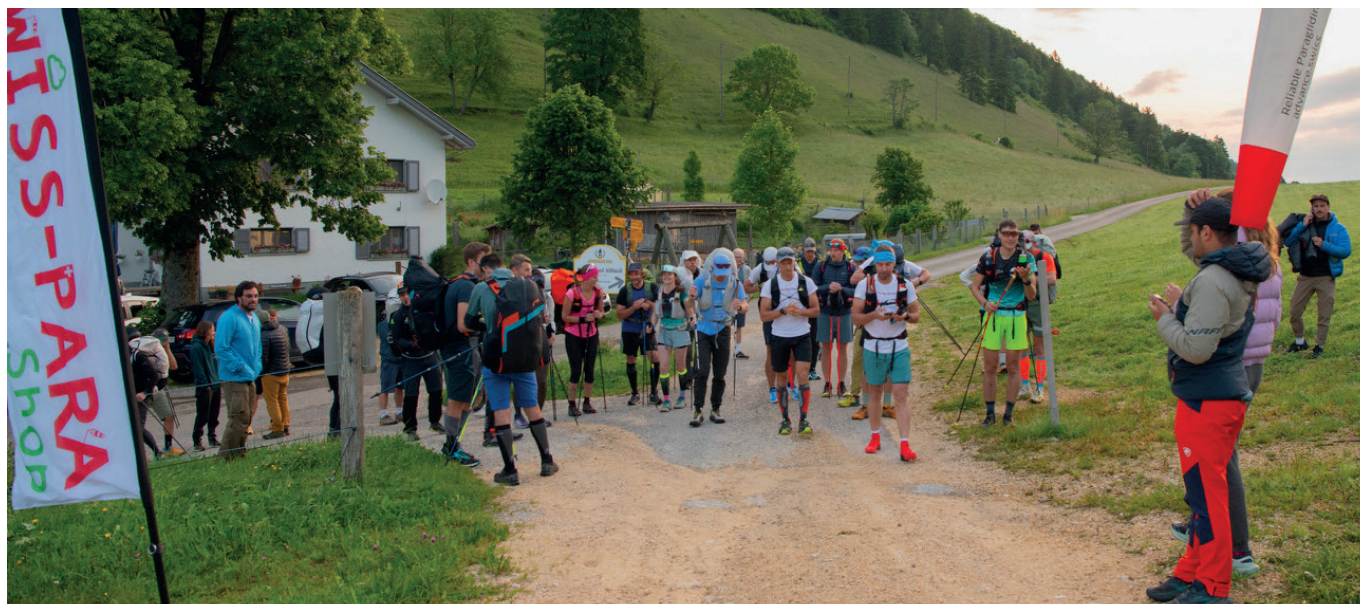
Quelques minutes avant le départ à 6h, au Binzberg restaurant.