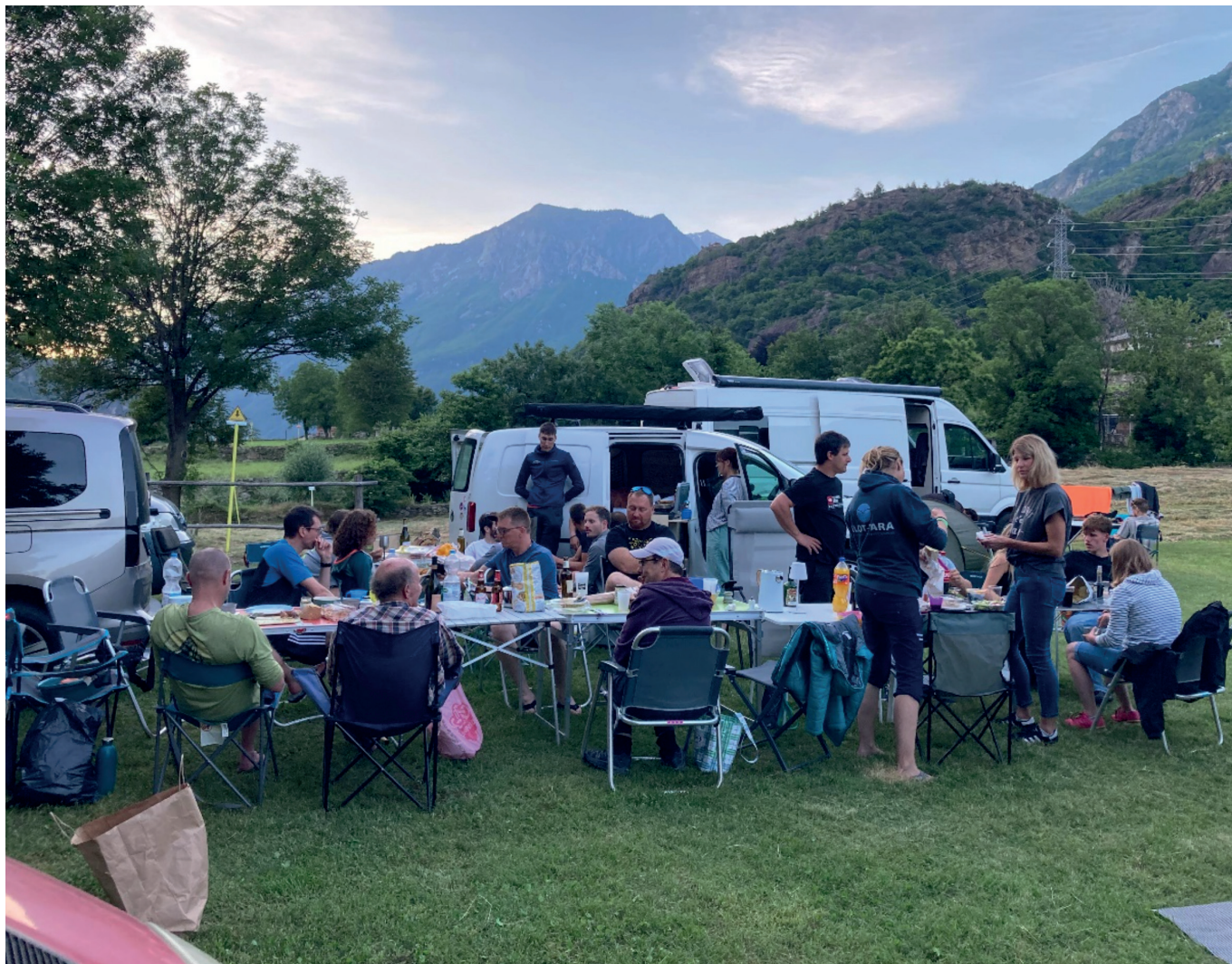
Une belle équipe au camping. (VG)