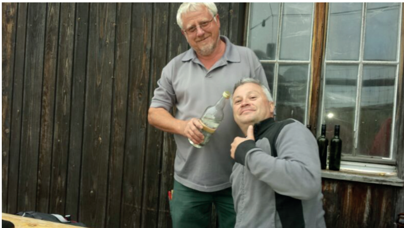
Un café loge : volontiers mais seulement après le vol... (NZ)