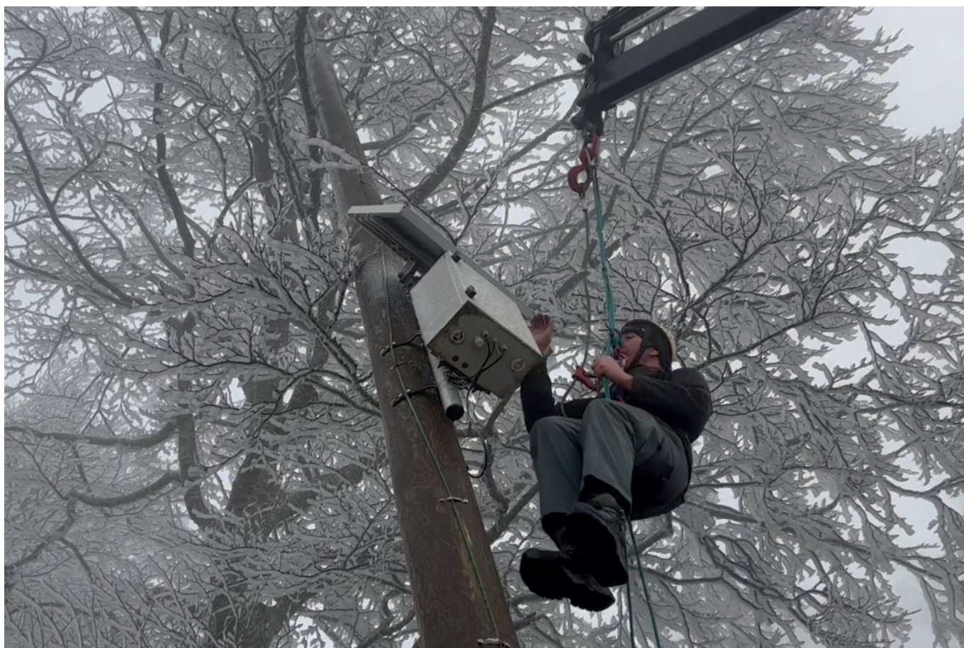
Opération de haute voltige du Pierre.