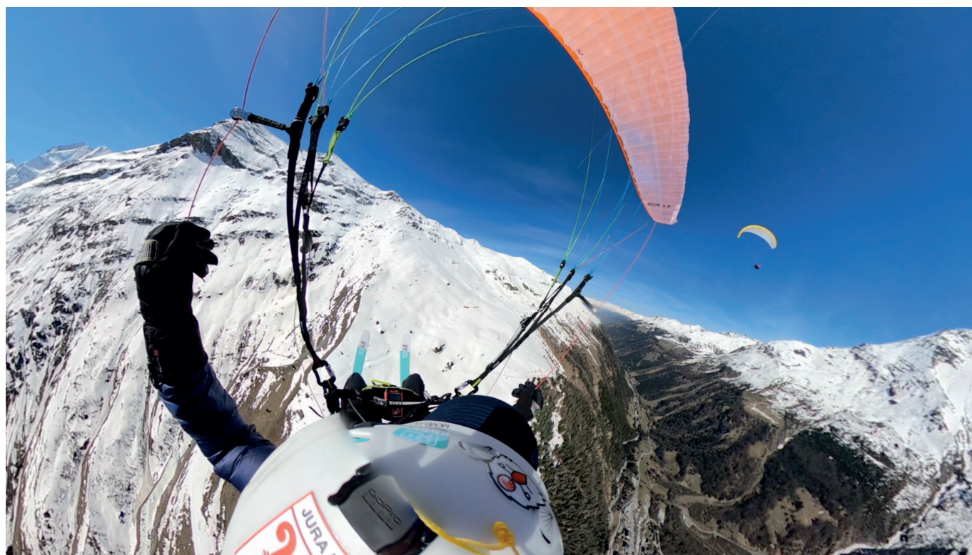
Après une belle montée en peau de phoque, Fabien et Linsey dansent ensemble dans ce petit thermique printanier à Zinal.