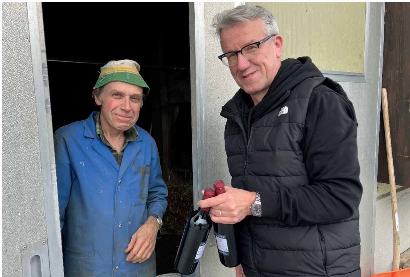
Il y a parfois des rencontres insolites... Et surtout, le geste est apprécié. Santé ! (db)

faivre, Delémont, Saint-Ursanne et Clos du Doubs). Un grand merci à eux pour ce travail de l'ombre. Et qui prend quand même un peu (beaucoup...) de temps. Si d'autres membres du VLJ désirent se joindre à l'équipe, il ne faut pas hésiter à s'annoncer. D'autant plus que chaque distributeur à droit à une bouteille, ou deux... !