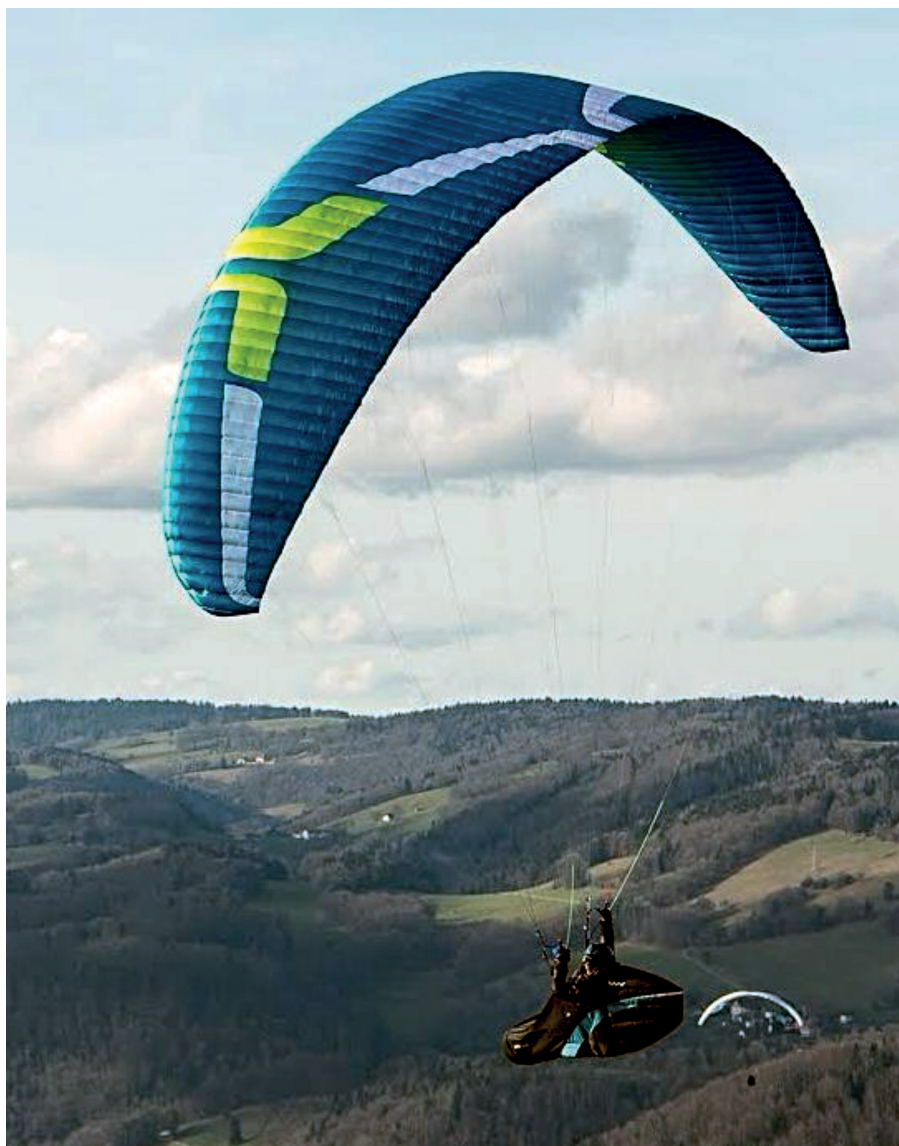
Fabio dans ses œuvres. (lp)

Alors je peux t'en parler d'un mais tous les vols sont beaux. Chaque vol a son charme et ses images qui restent imprimées dans le cerveau. Un vol que je n'oublierai jamais, c'était dans les Dolomites. Je devais être