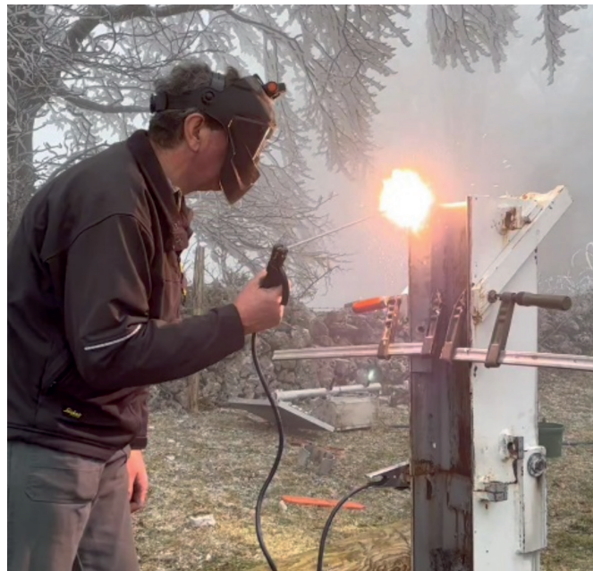
Pierre avait tout prévu... (db)