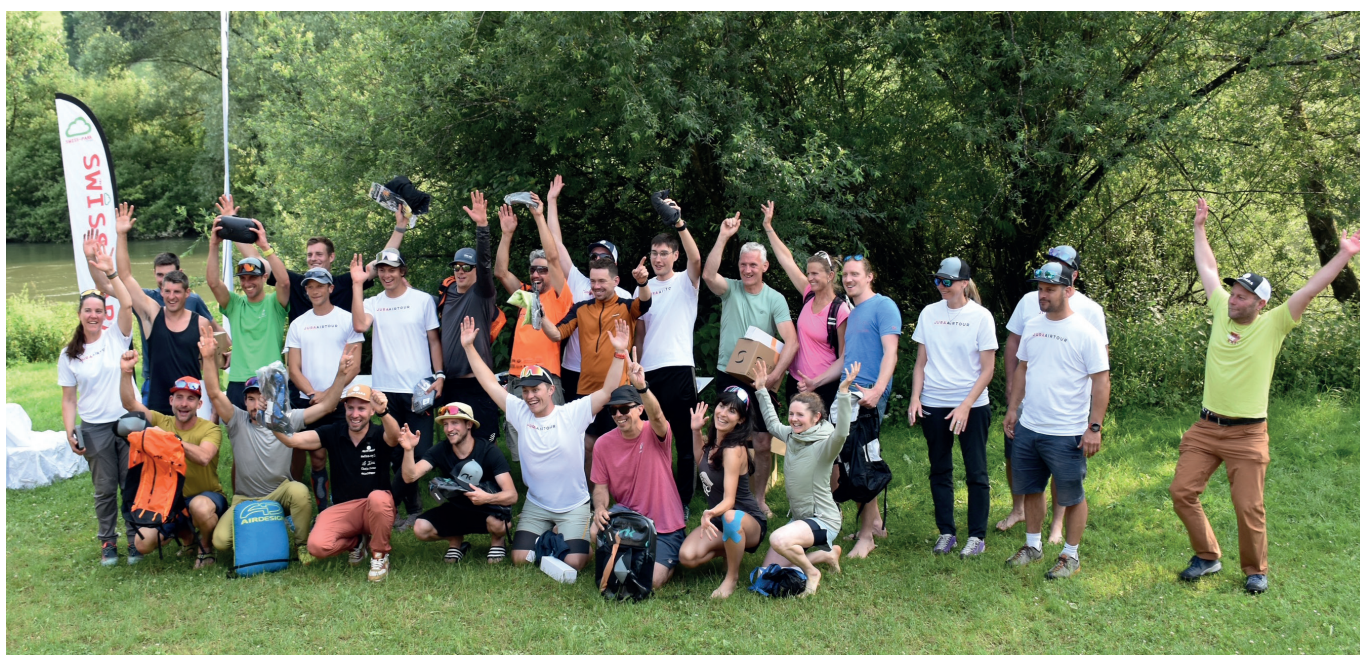
Fin de la course à la MT.