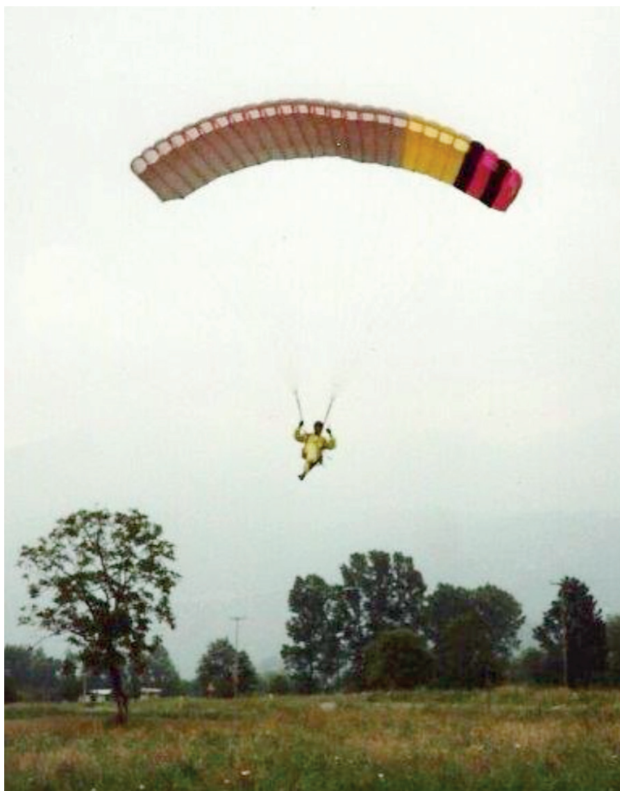
Voile Condor VIP. Perso, je l'aurais appelée VID : Very Importante Déformation.

Alors, il faut dire déjà que j'ai dû m'intéresser à la météo surtout depuis que je vole ici. En Italie, c'était facile, comme j'ai dit avant, on décollait au sud. Le ciel il est beau, tu voles. Ici, non. Je me suis mis à regarder mieux la météo. J'ai aussi suivi des cours avec un météorologue qui est aussi pilote et qui s'occupe de la météo pour les championnats de parapente de la fédération d'Italie.