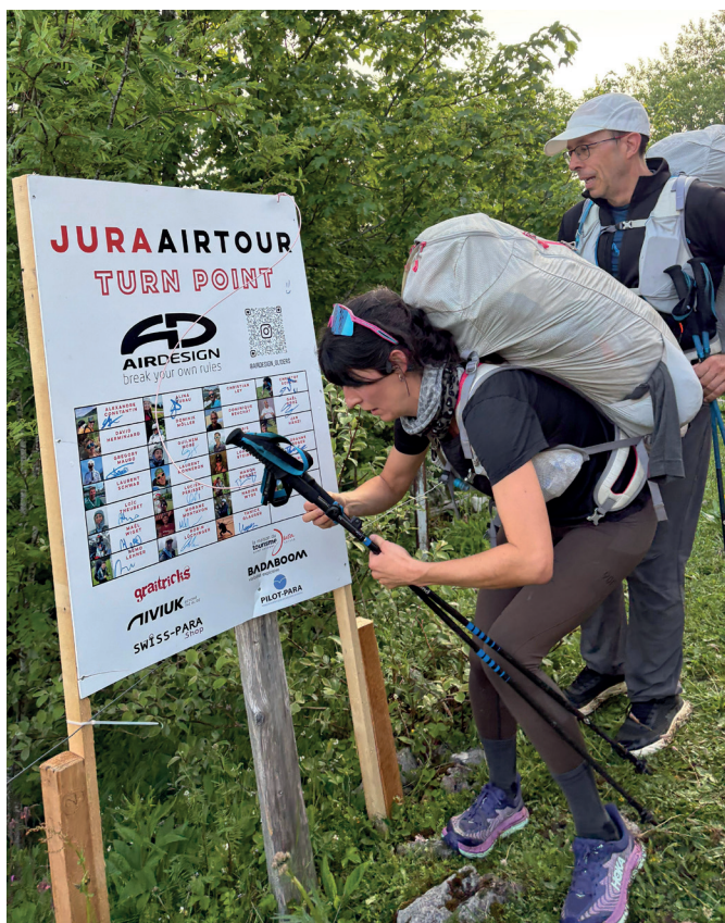
Arrivée au TP2 au Buement.