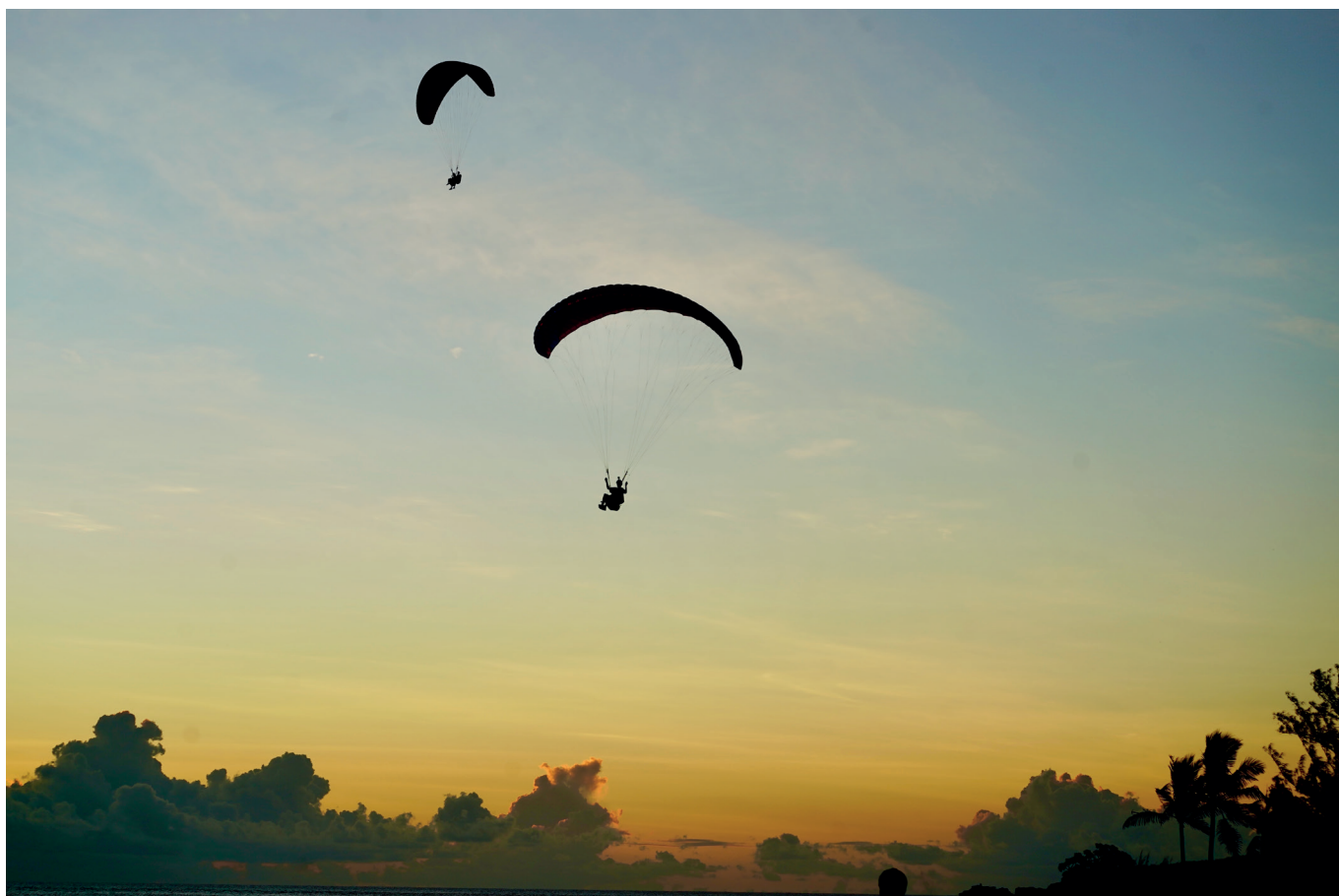
Les trois soeurs s'apprêtent à poser sur la plage réunionnaise, après un magnifique vol au sunset.